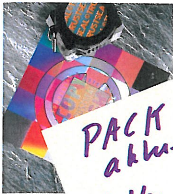
Sicherheitslösung Trustseal von Kurz.